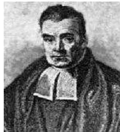
Thomas Bayes 1702 - 1761