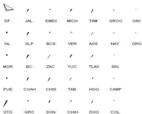
Figura 1. Diagramas estrella de número de proyectos aprobados respectivamente en fondos institucionales, fondos mixtos y sectoriales

Se ha dicho desde diferentes puntos de vista que México es un país desigual. Para muestra dos botones en lo relativo al financiamiento de la investigación científica y tecnológica. La Figura 1 muestra diagramas de estrella para cada una de las entidades de nuestro país en lo relativo al número de proyectos aprobados en fondos institucionales, fondos mixtos y fondos sectoriales. La Figura 2 muestra para cada entidad federativa los montos en los tres tipos de fondos mencionados. Los datos son oficiales extraídos del reporte Situación Financiera de los Fondos, informe al mes de enero de 2005, del CONACyT.