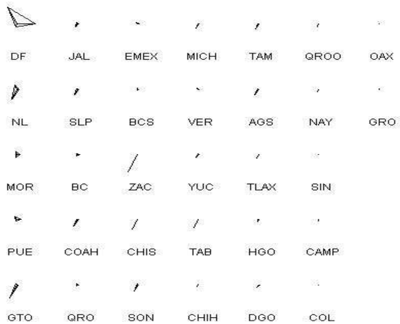
Figura 2. Diagramas estrella de montos totales de proyectos aprobados respectivamente en fondos institucionales, fondos mixtos y sectoriales